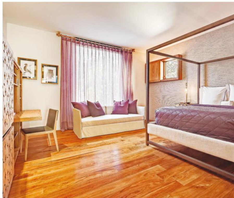
Nombre del proyecto: Casa JRQZ. Ubicación: México, D.F. Proyecto de interiores: López Duplan Arquitectos. Arq. Claudia López Duplan. Año: 2013.