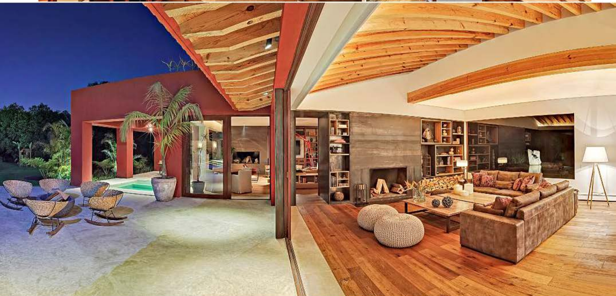
■ Las zonas públicas se abren por completo hacia la gran terraza.