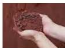
P38 PROYECTO: LOR DAG & SON DAG 2014, DISEÑO: SALVADOR COHPAÑ, AÑO: 2014