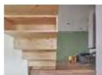
P42 DISEÑO: HAO DESIGN