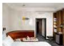
P42 PAUL RAESIDE WWW.TOWNSEND-LONDON.CO.UK