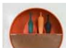
P43 DISEÑO: PATRICIA URQUIOLA COMPANY / COEDITIO.N