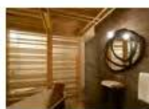
P47 PROYECTO: LA REGÁHARA DESIGN HOUSE, HATERIA: GUSTAVO CARHONÁ + LIZABELTRÁN, FOTOGRAFÍA: ALBERTO HORA