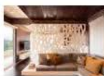
P46 PROYECTO: CASA BOSQUE DE NIEBLA, DISEÑO: BCA TALLER, DE DISEÑO LUGAR: JALAPA, VERACRUZ, AÑO: 2015