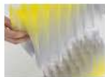
P50 HIRJAH HEHSTROH