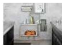
P44 HUUTO WWW.HUUTO.CO.UK