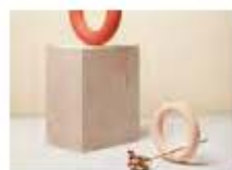
P45 AKATRE WWW.AKATRE.CO.UK