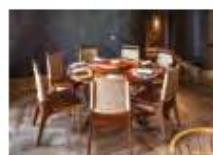
P41 PROYECTO: CHAPULÍN, ESPACIO: HOB, FOTOGRAFÍA: ALFONSO DE BÉJAR