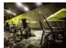
P55 PROYECTO: LA LEGENDARIA, DISEÑO: HIGUÉLDE LA TORRE ARQUITECTOS, AÑO: 2014, FOTOGRAFÍA: JORGE B. GARRIDO / DR. CALABERA