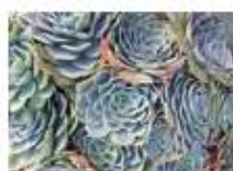
P32 PROYECTO: INSPIRACIÓN, DISEÑO: AHOATO STUDIO, AÑO: 2014