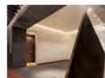
P40 PROYECTO: CASA CUHERRÉS SANTA FE, DISEÑO: LÓPEZ DUPLAN ARQUITECTOS, AÑO: 2015